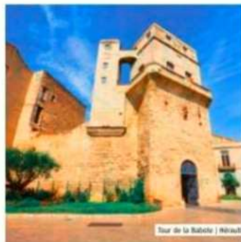
Tour de la Babote | Hérault

Elle devient, pendant près d'un demi-siècle, le centre de recherche des astronomes montpelliérains. La tradition orale rapporte que l'inventeur du parachute, Sébastien Lenormand, aurait testé son invention, en 1783, depuis le haut de la Babote. Après la Révolution, le percement d'un passage à la base de la tour compromet sa stabilité. D'observatoire, elle devient, en 1832 une tour de signal équipée d'un télégraphe Chappe. Cette nouvelle vocation au service de la communication est renforcée, à la fin du XIX e siècle, avec l'installation de la Société colombophile de l'Hérault. > Hauteur : 26 m